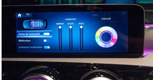
Qual der Wahl 10 Grundfarben und 64 Nuancen stehen zur Auswahl

Nach diesen ersten Eindrücken wird schnell ersichtlich, dass sich die zweite Ausgabe der Mercedes-Schräghecklimousine ästhetisch nicht grundlegend verändert hat. Der Längenzuwachs (+16 cm) verleiht ihr ein schlankeres Aussehen. Doch auch wenn die A-Klasse nun zu den grösseren Kompakten gehört, ist der Platz an Bord und das Kofferraumvolumen (+29 l) kaum grösszügiger als bei Konkurrenzmodellen. Hinter dem Lenkrad merkt man schnell, dass dieses digitale Raumschiff der Dynamik und dem Fahrspass den Vorzug gibt. Im Agglomerationsverkehr relativ straff abgestimmt, erweist sich die A-Klasse dennoch als guter Reisewagen. Sie ist etwas weniger wendig als die meisten Kompaktwagen, vermittelt ein sicheres Fahrverhalten, fühlt sich aber eher synthetisch an. Ähnlich verhält sich der 2-Liter-Turbomotor, der seine 224 PS konstant und unaufgeregt linear entfaltet. Die aufregende Seite der A-Klasse steckt in ihren Fahrassistenzsystemen, die ebenso ausgeklügelt wie das digitale Armaturenbrett sind. Wer sich von der Optionenliste bedient, kann einen adaptiven Tempomaten und einen Totwinkel-Assistenten für sich arbeiten lassen, der vor ungesesehenen Radfahrern warnt. Oder das Navi, welches die Augmented-Reality-Bilder direkt durch die Windschutzscheibe auf die Kreuzungen projiziert.