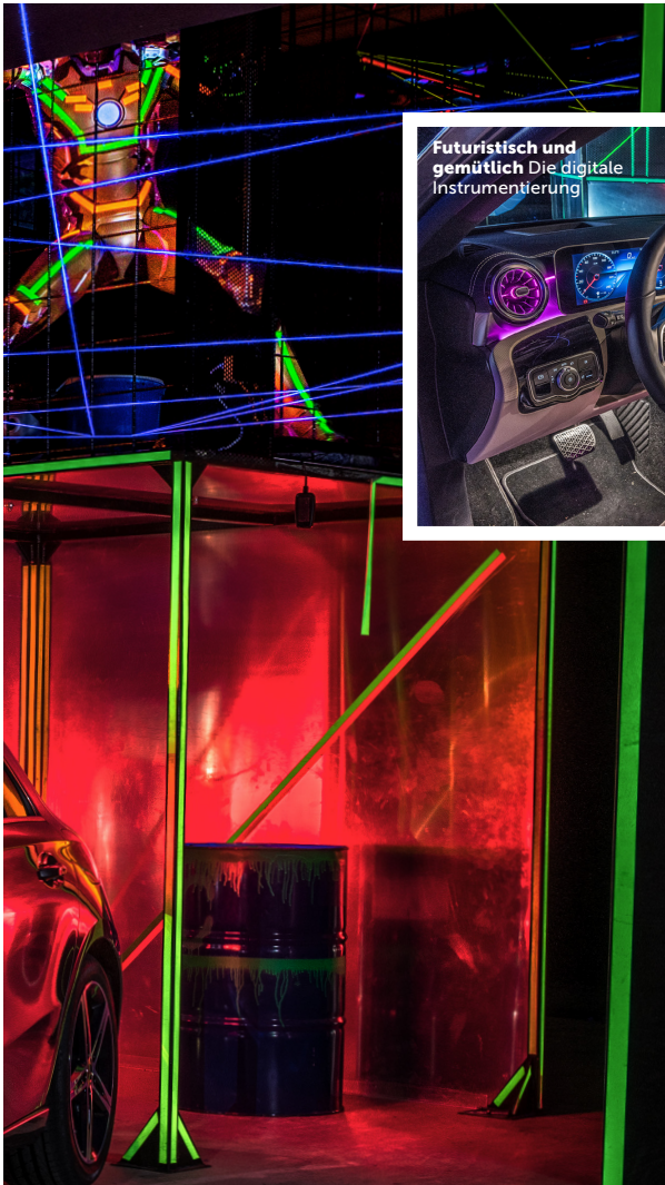
Futuristisch und gemütlich Die digitale Instrumentierung