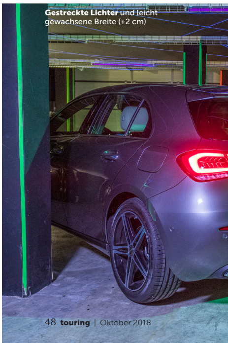
Gestreckte Lichter und leicht gewachsene Breite (+2 cm)