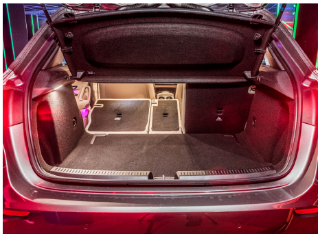
Nicht riesig, aber leicht zugänglich