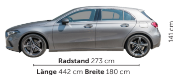
Kofferraum: 370–1210 Liter Reifen: 225/45 R18, min. 205/55 R17