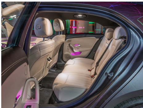
Kompakt mit ausreichend Platz